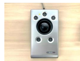
ポインティングデバイス 手のふるえ等があっても 使えるトラックボール等。

さまざまな障がいに対応する機器 センターでは、下記のようなICT機器を展示しています。