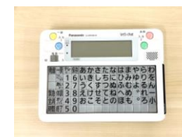
意思伝達装置 1つの入力スイッチだけで、 文章の表示・読み上げ等が できる。