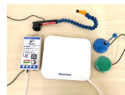
スイッチ各種 頬や指先等の身体の一部を 使って、わずかな力で機器 操作ができる。