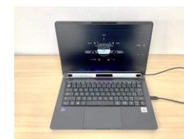
視線入力装置 目の動きだけでパソコン 操作ができる。